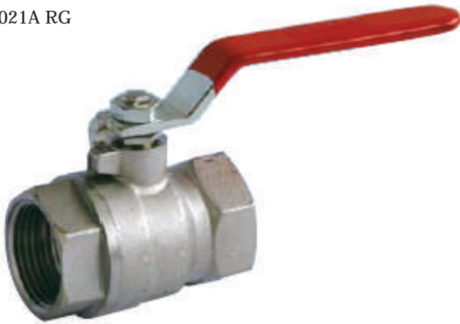
Fig. 2021A RG